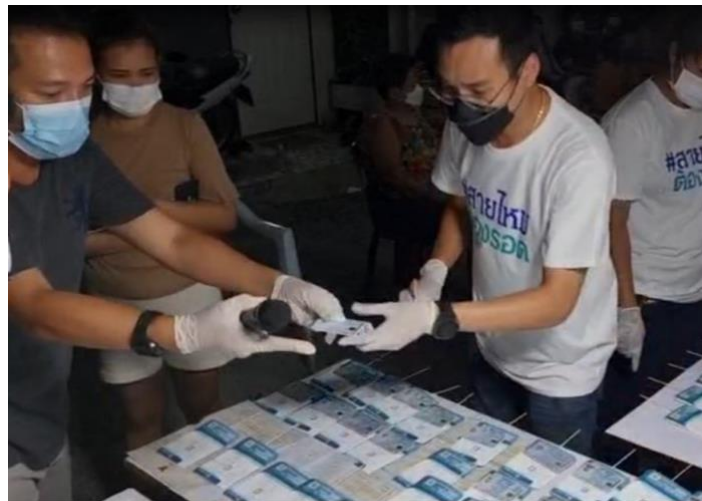
สายไหมอ่วม "คลัสเตอร์ us." ลามหมู่บ้าน ตัดเชื้อ-กักตัว รวมกว่า 200 ราย

เว็บไซต์: https://www.thairath.co.th/news/local/bangkok/2329673